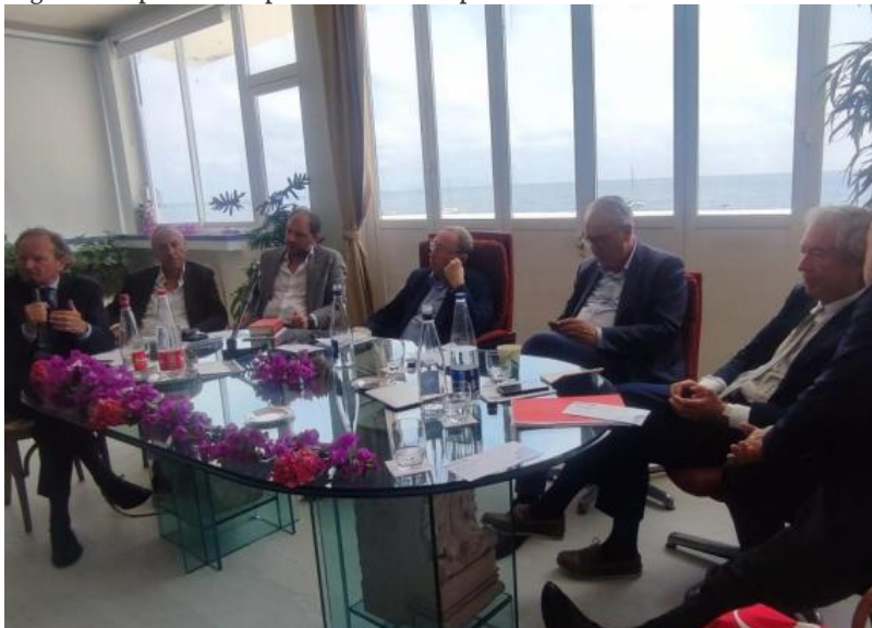
Un momento dell'incontro al Miramare Resort