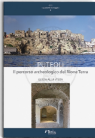
Copertina della guida "Puteoli. Il percorso archeologico del Rione Terra"